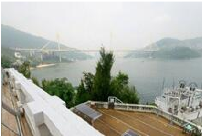
機場核心計劃展覽中心(白樓)