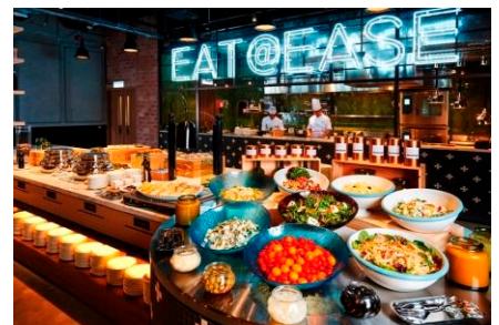
旭日酒店半自助餐

★饒宗頤文化館位於香港九龍荔枝角青山道800號的建築群暨多用途文化平台，以已故香港漢學家饒宗頤教授命名。文化館前身為荔枝角醫院，為香港三級歷史建築，是香港政府發展局文物保育專員辦事處在「活化歷史建築伙伴計劃」中的首批活化項目，於2009年由香港中華文化促進中心重新規劃及展開活化工作。